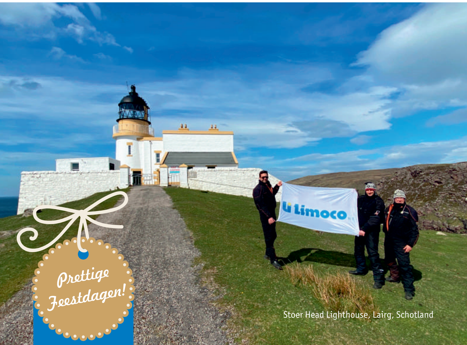
Stoer Head Lighthouse, Lairg, Schotland

Nieuwsbrief voor klanten, medewerkers en relaties Jaargang 16 - Nr. 2 - December 2023